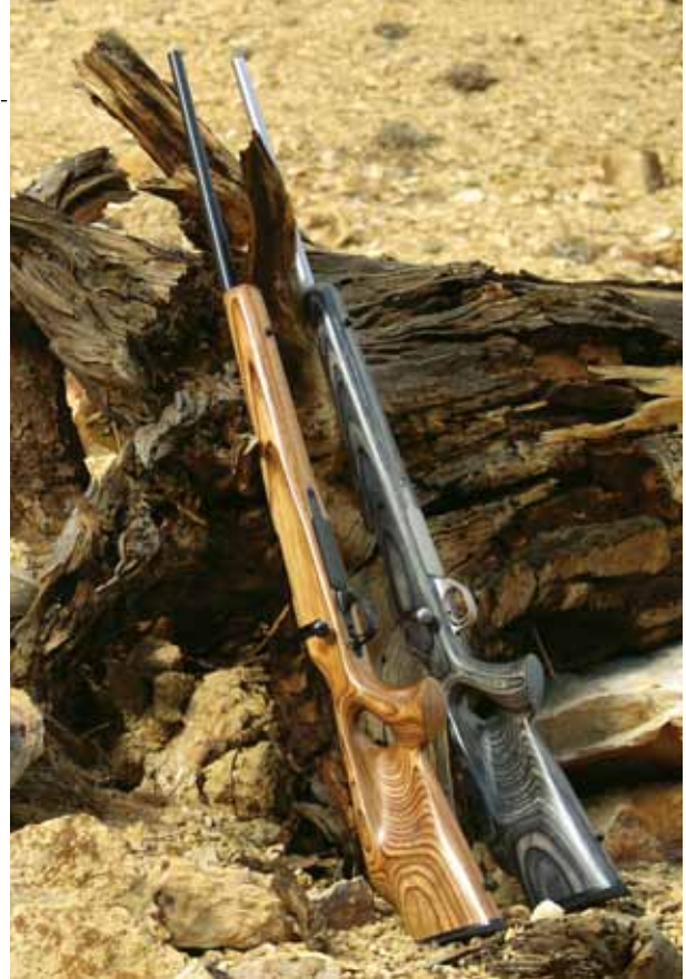
» Kulovnice Hova v polymerném pažbení Hogue Overmolded a v pažbení z laminovaného dřeva

několik desítek tisíc kusů, které se liší pouze použitou pažbou, ráží, délkou a průměrem hlavně. Poptávka se každým rokem výrazně zvyšuje.